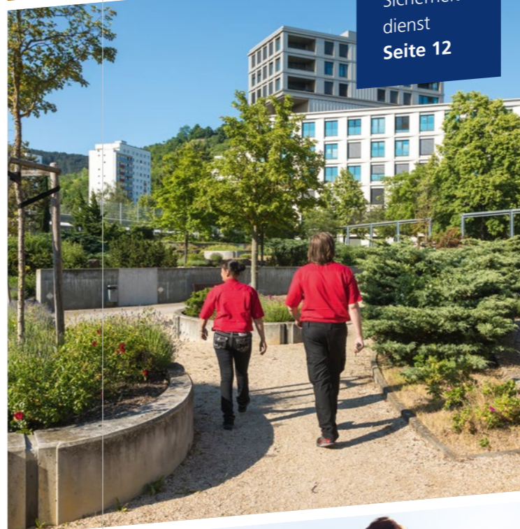
Unterwegs mit dem Sicherheits- dienst Seite 12