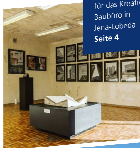
Auszeichnung für das Kreative Baubüro in Jena-Lobeda Seite 4