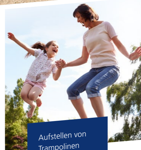
Aufstellen von Trampolinen und Pools in den Wohnquartieren Seite 17