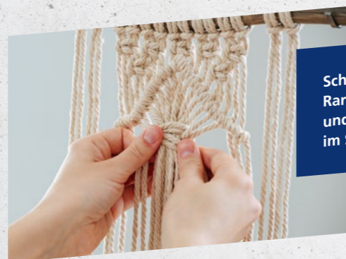
Schnäppchen und Raritäten beim Floh- und Kreativmarkt im Sommer 2022.

Entstanden ist das Kreative Baubüro in der Stauffenbergstraße 10 auf Initiative von jenawohnen-Mitarbeitern, die sich hier nach wie vor teilweise ehrenamtlich engagieren. Die Idee dahinter war es, die vorhandenen Flächen auf kreative Weise neu zu nutzen. Deshalb haben wir als Standort bewusst das Erdgeschoss eines Siebzigerjahre-Plattenbaus direkt hinter dem Kaufland gewählt. Wir wollten weg vom Klischee der „Platte“ und wollten zeigen, dass Kultur auch mitten im Wohngebiet stattfinden kann. Früher war in den Räumen die Filiale eines Floristen untergebracht – heute sieht es dort weniger blumig aus, um Raum für Kreativität, Ideen und Gestaltung zu lassen.