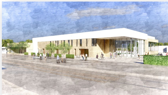
Neubau Schwimmhalle Lobeda