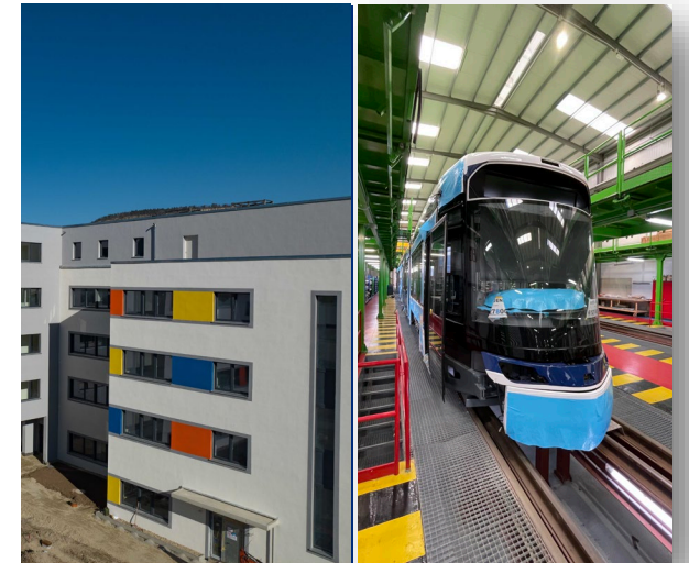
Neubau Göschwitzer Str.